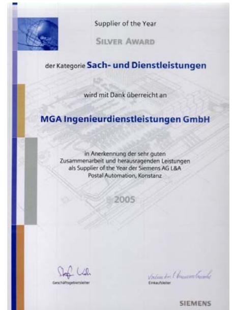
Urkunde - Silver Award als Supplier of the Year